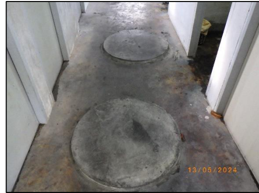
รูปที่ 2-2 ห้องสุขาและจุดติดตั้งบ่อเกรอะ บริเวณหลังโกดังพักสินค้า