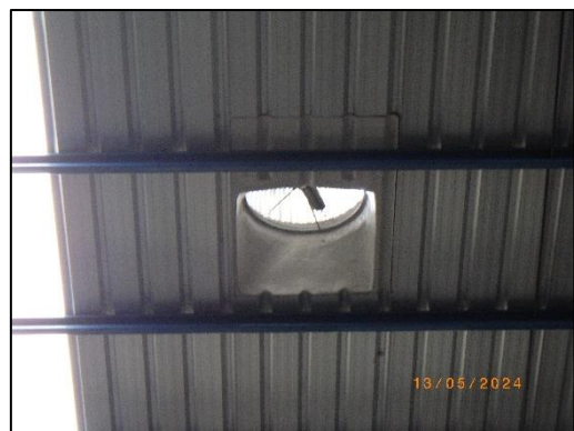
รูปที่ 2-8 ระบบระบายอากาศบนหลังคาของโกดังพักสินค้า