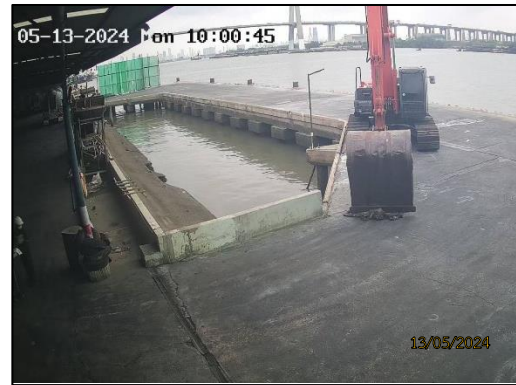
รูปที่ 2-13 ระบบกล้องวงจรปิด CCTV