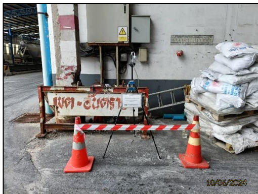
รูปที่ 2-9 การติดตามตรวจสอบคุณภาพอากาศ บริเวณโกดังสินค้า