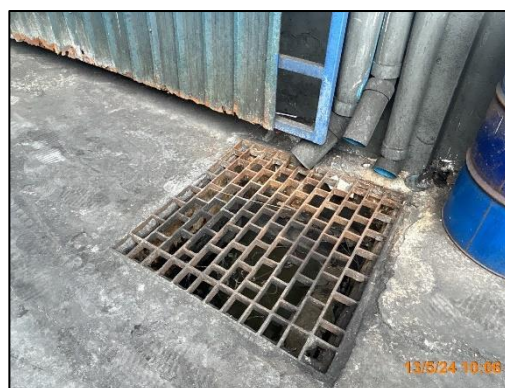
รูปที่ 2-11 ท่อระบายน้ำทิ้งภายในพื้นที่โครงการ