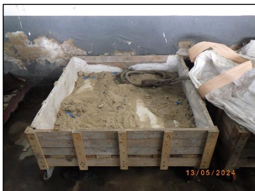
รูปที่ 2-5 วัสดุดูดซับน้ำมันบริเวณหน้าท่าเทียบเรือ