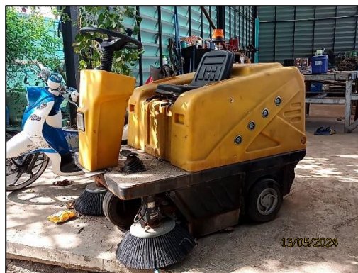
รูปที่ 2-7 การควบคุมการฟุ้งกระจายของฝุ่นละออง ขณะขนถ่ายสินค้า