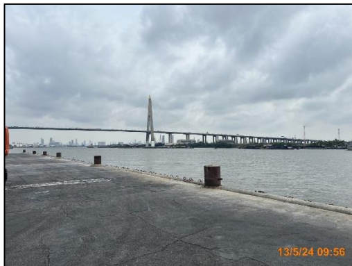
รูปที่ 2-3 บริเวณหน้าท่าเทียบเรือ