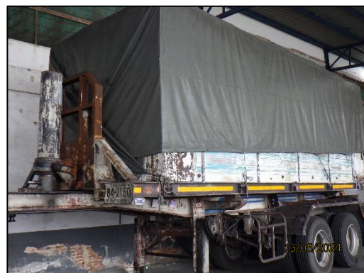
รูปที่ 2-6 การปิดคลุมสินค้าก่อนทำการขนส่ง