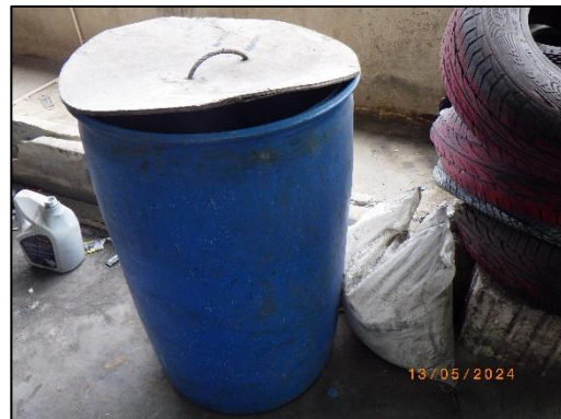
รูปที่ 2-4 ภาชนะรองรับขยะบริเวณหน้าท่าเทียบเรือ