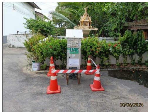
รูปที่ 2-10 การติดตามตรวจสอบคุณภาพอากาศ บริเวณพื้นที่ภายในโรงงาน