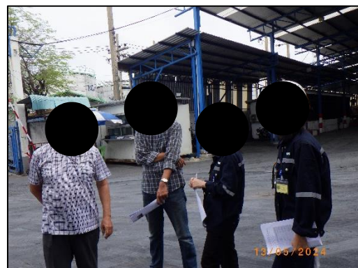
รูปที่ 2-1 การติดตามตรวจสอบการปฏิบัติตามมาตรการฯ ระหว่างเดือนมกราคม-มิถุนายน พ.ศ. 2567 โดย Third party ร่วมกับผู้แทนจาก บริษัท รวมทุนไทย จำกัด