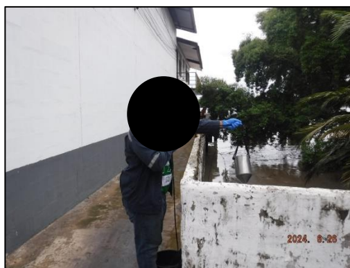
รูปที่ 2-12 การติดตามตรวจสอบคุณภาพน้ำทิ้ง